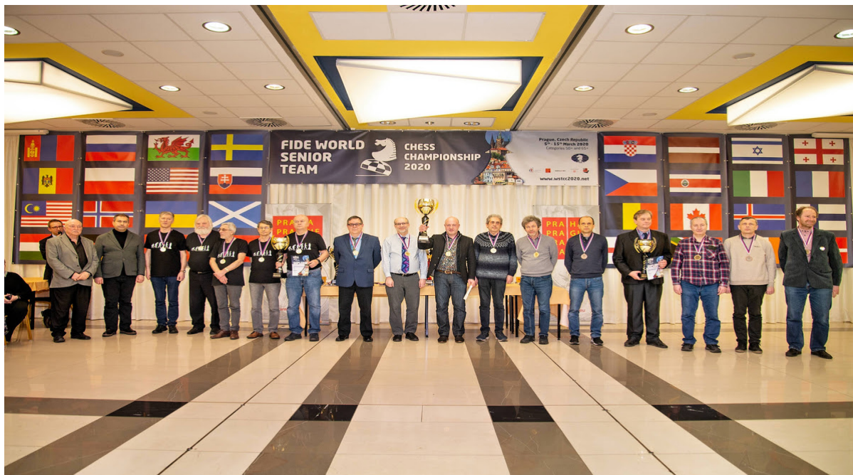
Vyhlášení vítězů - kategorie mužů nad 50 let